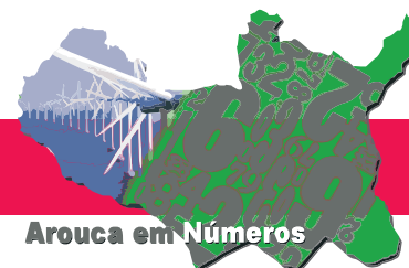
Consumidores de Electricidade, por tipo de consumo