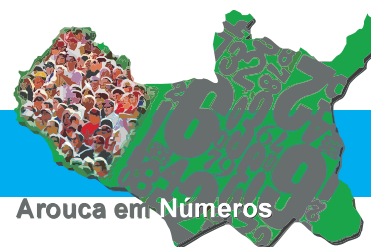
População Residente Total (Nº)