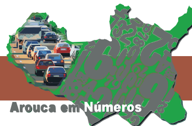
Veículos comprados, em Arouca